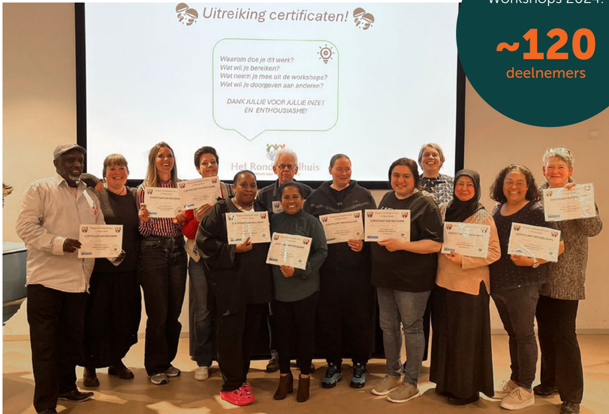
Workshops voor religie en cultuur.